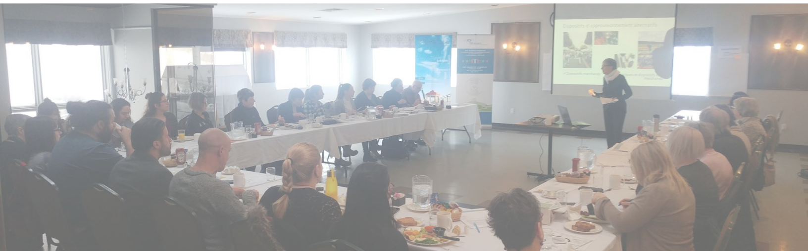
Table de lutte à la pauvreté régionale de la Table régionale des élus municipaux de la Chaudière-Appalaches (TREMCA): Nous siégeons comme représentant de l'Alliance des partenaires C.A. à cette nouvelle table formée dans le cadre du Plan d'action gouvernemental pour l'inclusion économique et la participation sociale (PAGIEPS) 2017-2023 pour la gestion du Fonds québécois d'initiatives sociales (FQIS).

Groupe de réflexion et d'action contre la pauvreté (GRAP) de Chaudière Appalaches: La CDC y siège comme représentante de son GRAP local et fait également partie du comité de coordination.